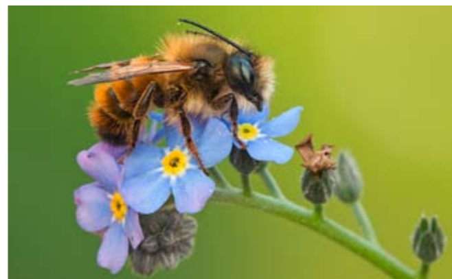
Une abondance de fleurs en été profite aussi à l'osmie bicorne

Les lieux de nidification et la nourriture à disposition sont des éléments décisifs pour la présence d'abeilles sauvages. Semez un mélange pour friche avec de la chicorée sauvage, de la nielle des blés ou du réséda le long de la clôture de votre jardin. N'arrachez ni les molènes, ni les vipérines qui apparaissent spontanément sur l'allée de gravier, mais laissez-les fleurir.