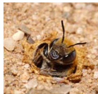
Les larves d'abeilles sauvages hivernent dans des cellules de couvain, bien cachées sous la terre et dans d'autres cavités

Les abeilles ont maintenant fait leur nid dans des endroits propices – espaces ensoleillés au sol ou tiges de plantes – qu'il faudra laisser tranquilles jusqu'à ce que les abeilles prennent leur envol au printemps prochain. Apportez-leur votre aide : n'éliminez pas toutes les plantes en automne. Laissez des tas de branches sur le sol pendant toute la durée de l'hiver. Ne retournez pas la terre aux endroits dégagés, surtout là où vous avez vu disparaître des abeilles sauvages en été. Des larves s'y cachent peut-être pour hiverner.