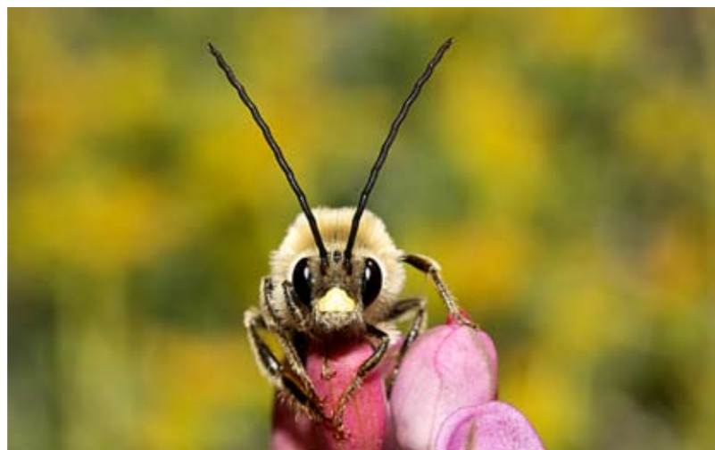
Aisément reconnaissable : un mâle d'abeille à longues antennes avec ses antennes caractéristiques

La fleur rose se balance imperceptiblement sous le poids de l'abeille qui vient de s'y poser. Elle se met à aspirer du nectar avec application. Quelles drôles d'antennes elle a sur la tête ! Cela ne peut pas être une abeille domestique. Et pourtant, elle a quelque chose d'elle... Nous y sommes, c'est certainement l'abeille à longues antennes !